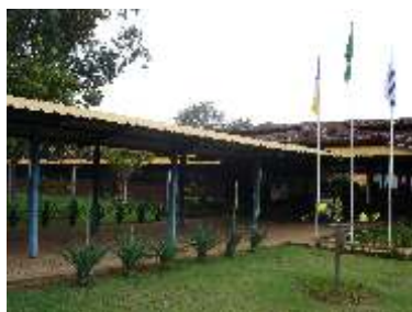
Campus Palmas do IFTO começa novo ano letivo com diversas melhorias Página 03