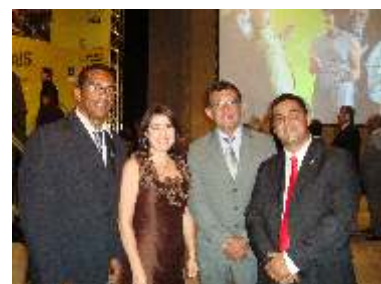
Instituto Federal do Tocantins inaugura os Campi de Araguaína, Gurupi e Porto Nacional. Página 04