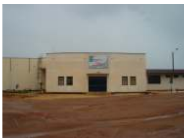
Investimentos no Campus de Paraíso do Tocantins para 2010 somam mais de R$ 200 mil Página 02