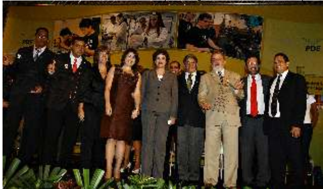
Diversas autoridades estiveram presentes à inauguração dos 78 novos campi da Rede Federal de Educação Profissional e Tecnológica

A cerimônia de inauguração de 78 novos campi da Rede Federal de Educação Profissional e Tecnológica no Brasil foi realizada na última segunda-feira, 1 de fevereiro, em Brasília.