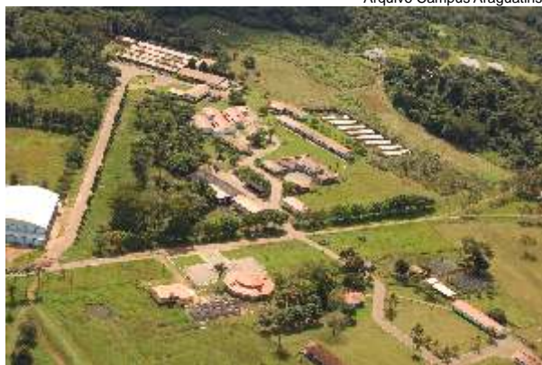
Vista aérea do Campus de Araguatins do IFTO, que recebe neste novo ano letivo cerca de 2 milhões de reais em investimentos