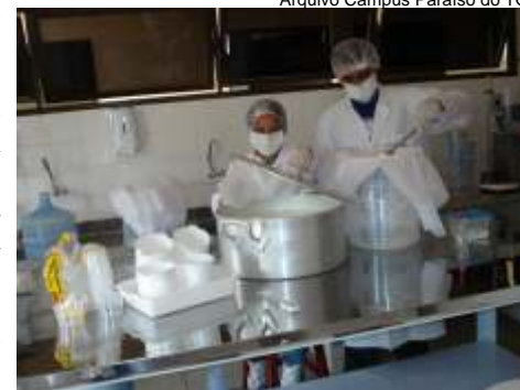
As diversas melhorias no Campus Paraíso refletirão diretamente no aprendizado dos estudantes

expandindo-se segundo as necessidades regionais, e de acordo com criteriosas pesquisas para identificar a vocação regional, objetivando ofertas de cursos que atendam às de-