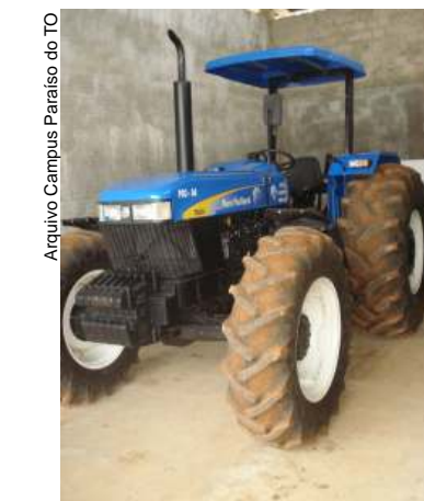
Aquisição de trator agrícola para as aulas de campo do IFTO-Paraíso

A aquisição de acervo bibliográfico e de 1 ônibus escolar, também estão entre as novidades para este ano.