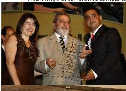
Reitora e Diretor do Campus de Porto Nacional receberam placa de inauguração do Presidente Lula

Gurupi terá neste ano os cursos de Licenciatura em Artes, Técnico Subsequente em Artes Dramáticas e Técnico Subsequente em Edificações. Já, Araguaína dará continuidade à oferta dos cursos Técnico Subsequente em Enfermagem, em Gerência da Saúde, em Informática para Internet e Pós-Graduação em Proeja.