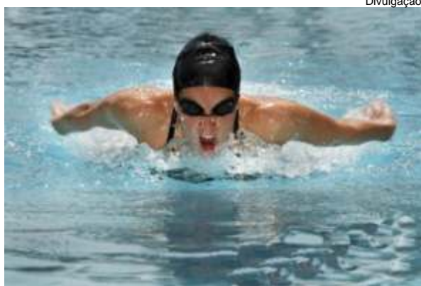
A natação será uma das modalidades esportivas do JIFEN 2009

Para esta sexta edição do JIFEN participam 05 (cinco) Institutos Federais de Educação Profissional e Tecnológica. Serão cerca de 10 campi envolvidos, com a previsão para a participação efetiva de aproximadamente 450 (quatrocentos e cinquenta) pessoas, entre atletas, técnicos e dirigentes.