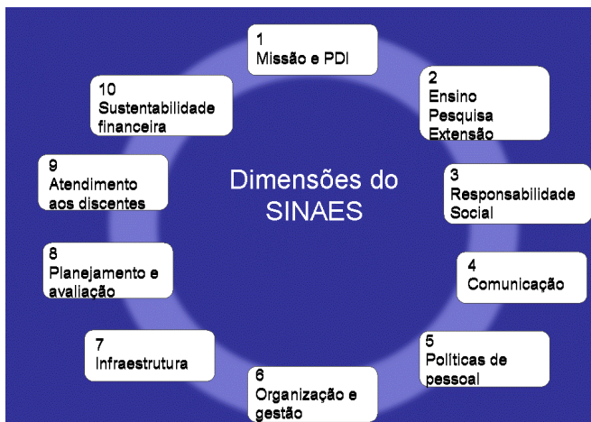
Comissão deverá observar etapas do Sistema Nacional de Avaliação da Educação Superior

A forma de composição, a duração do mandato de seus membros, a dinâmica de funcionamento e a especificação de atribuições da Comissão deverão ser objeto de regimento próprio.