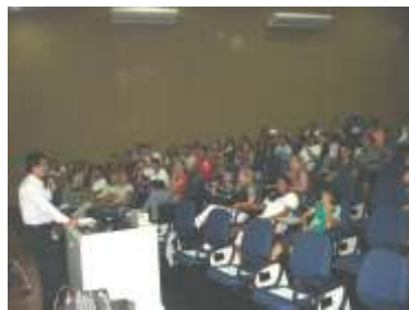
I Semana do Administrador é realizada pelo campus Paraíso do Tocantins Página 03