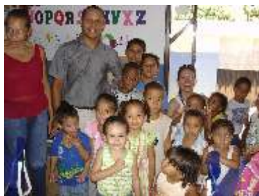
Destaque para ações da Direc do campus Palmas Página 02

Através da ampliação de seu orçamento o IFTO poderá expandir ações junto à sociedade Página 03