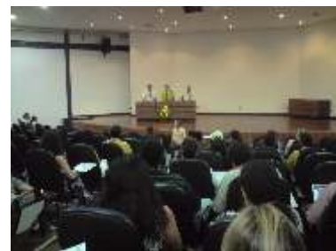
Seminário de Políticas de Gestão reúne autoridades, gestores e comunidade do IFTO Página 04