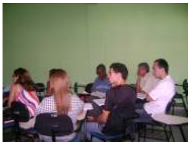
Campus Araguatins realiza eleições de representantes para comunidade acadêmica Página 02