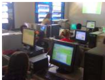
Estudantes do Ensino a Distância do IFTO têm aulas presenciais e laboratórios para pesquisas Página 03