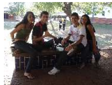
IFTO faz homenagem em comemoração ao Dia do Estudante Página 04