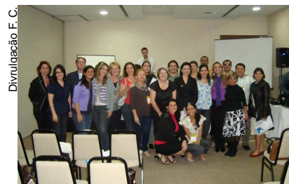
Comunicadores se reúnem para discutir demandas dos IF's

conteceu o terceiro encontro de comunicadores em Brasília e as demandas contemplaram além da política de comunicação dos Institutos, as inaugurações dos novos campi, os encaminhamentos para o Fórum Mundial de Educação Profissional e Tecnológica, a normatização de vários instrumentos que são utilizados pelos IF's como, os manuais de Identidade Visual, de Redação Oficial, de Utilização da marca e ainda estratégias de comunicação comuns aos Institutos.