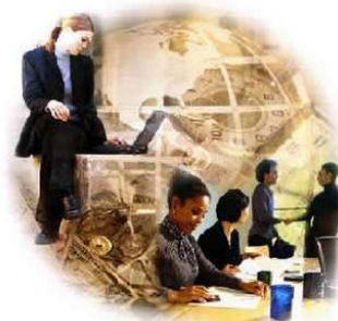
IFTO se prepara para construir seu Planejamento Estratégico Página 03