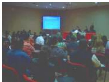
Instituto presente no Fórum de Comunicadores da Rede Federal Página 02

Instituto Federal do Tocantins deu início ao segundo semestre letivo de 2009 com diversas atividades e programações Página 03